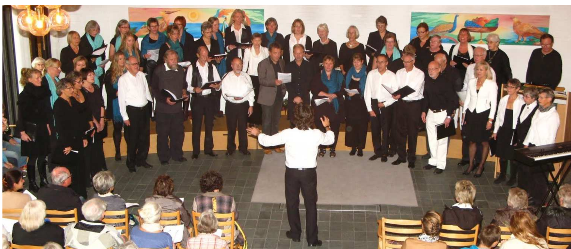
To velbesøgte koncerter i Skovvejskirken og i Borup Kirke illustrerede forskellen mellem gospelmusik, fremført af HighOnGospel og Spirituals, præsenteret af Ballerup Kammerkor.